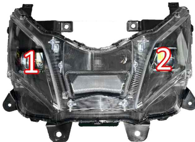
(本示意燈組 GMS-X 本體外框為黑)