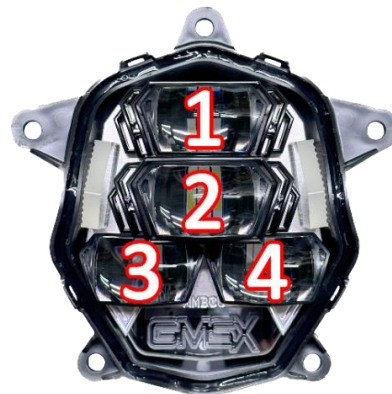
(本示意燈組 GMS-X 本體外框為黑)

LED 魚眼內光圈 (四眼) NT:4000 (如選購此項請於下方填寫相對應之顏色)