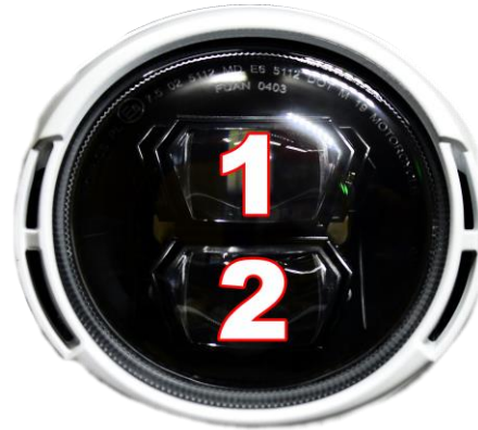
(NEW Many 125)