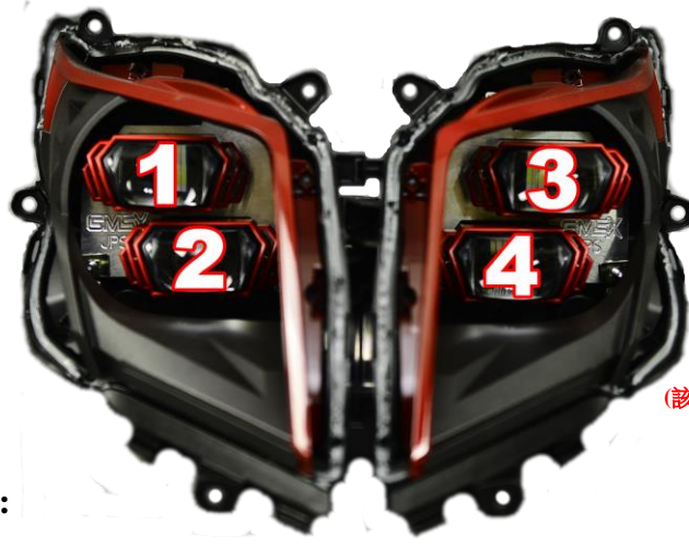
(該示意圖樣式為本體黑、飾圈紅)

※飾圈位置顏色: 1. _____ 2. _____ 3. _____ 4. _____