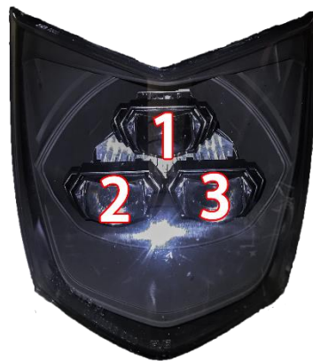
(本示意燈組 GMS-X 本體外框為黑)