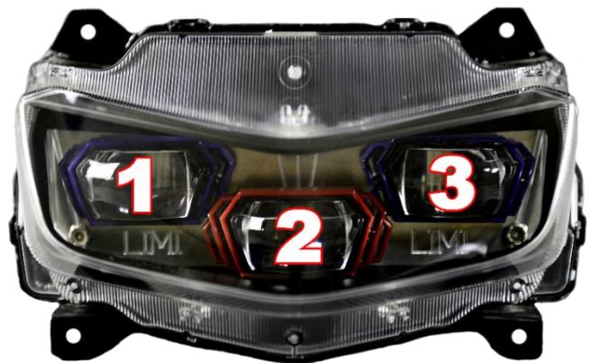
(本示意燈組 GMS-X 本體外框為黑)